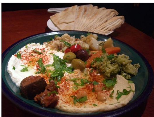
Fig. 2 Produsele pe bază de lapte și smântână sunt ingrediente predominante în bucătăria saudită

Consumul de ceai din Arabia Saudită este adesea însoțit de lapte condensat, iar smântâna este de obicei folosită ca ingredient pentru gătit. Consumul general al acestor produse nu este de așteptat să scadă, totuși datorită încetinirii creșterii economice, consumatorii se așteaptă să se orienteze spre mai multe opțiuni economice.