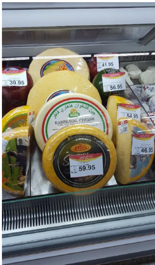
Fig. 1 Brânzeturile importate, de tipul cașcaval, au potențial de creștere pe piață

Campaniile de conștientizare a unui mod de viață sănătos, precum și modernizarea industriei medicale din Arabia Saudită, disponibilitatea medicilor și consultațiilor despre